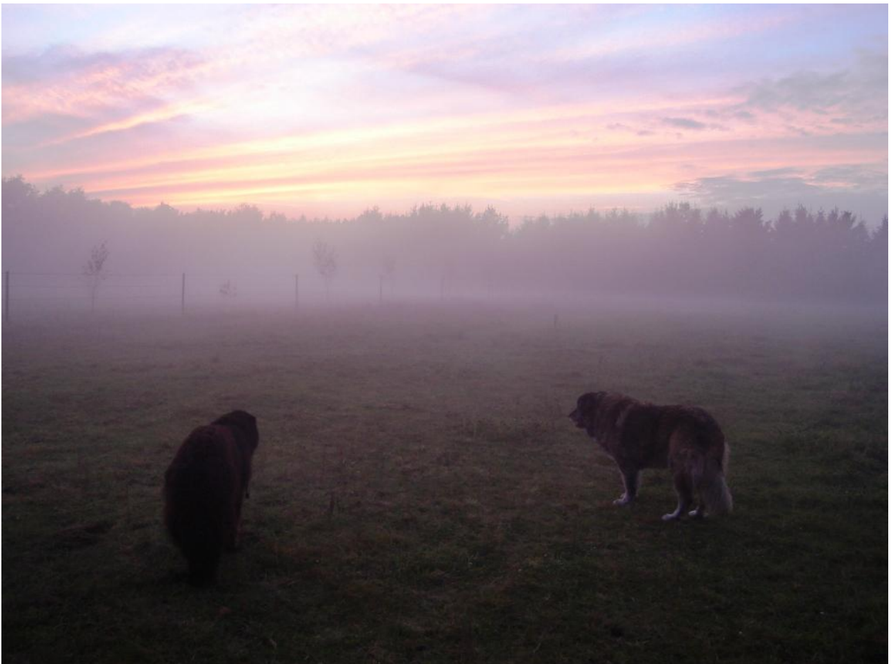
Harry und Eve

Wir wünschen euch ein schönes und erfülltes Hundejahr 2018!