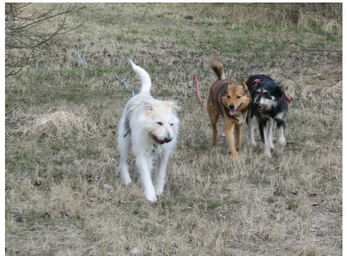
Kate flirtet mit Rasun...