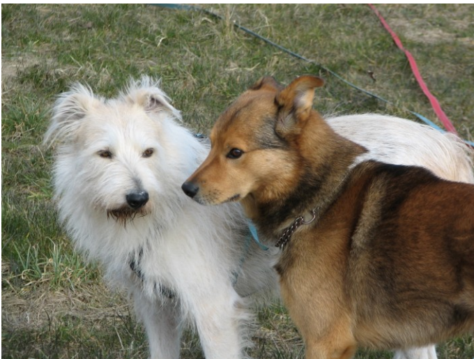
„Ja, wir Rumänen, was?“