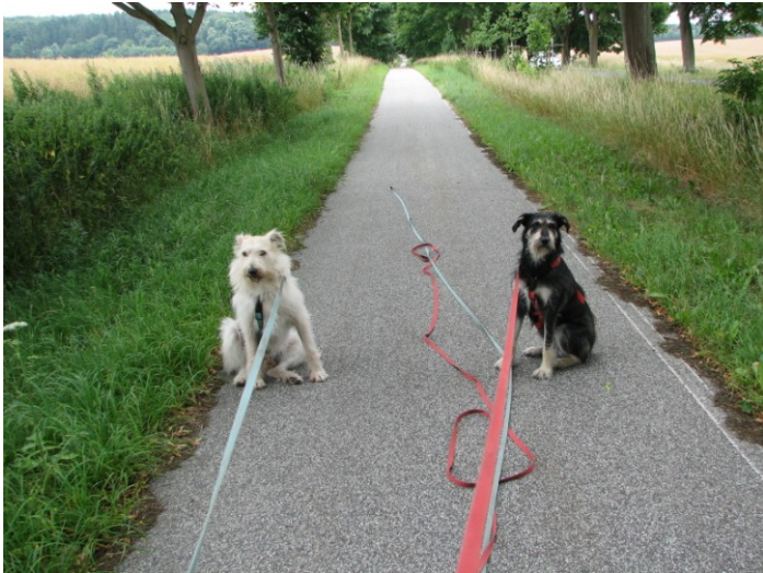
Wir haben die Schnauze voll!