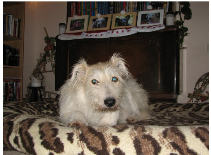
Harvey: „Ich auch nicht! Ich mach eigentlich nie was!“