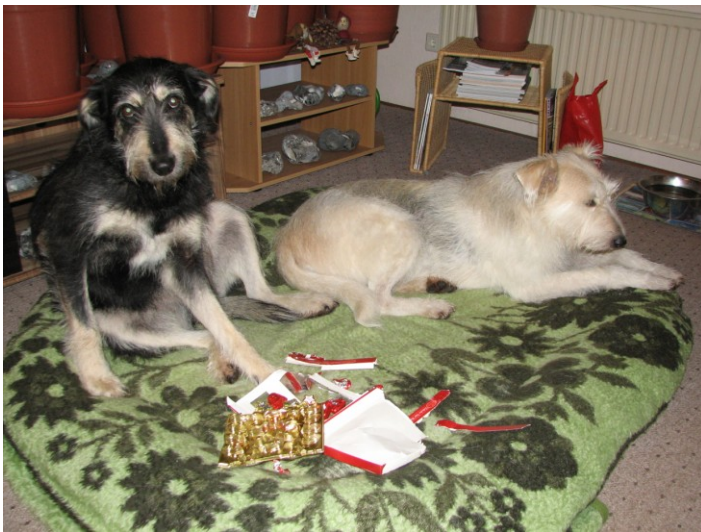
Kate: „Hab nichts gemacht, das lag plötzlich da.“