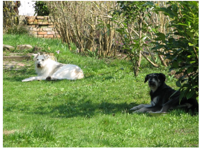
„Wolltest Du nicht Kuchen essen???”