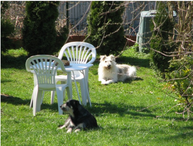
Hier ist das Stück Kuchen auf dem Tisch kurz noch zu sehen...