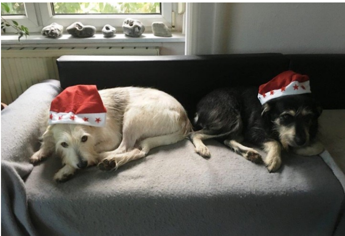
„Ganz ohne Schnee ist aber auch doof.“