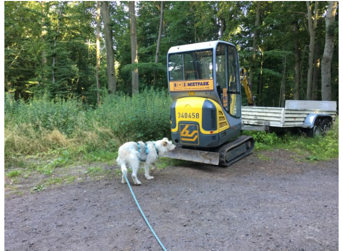
Bodo mit dem Bagger ...