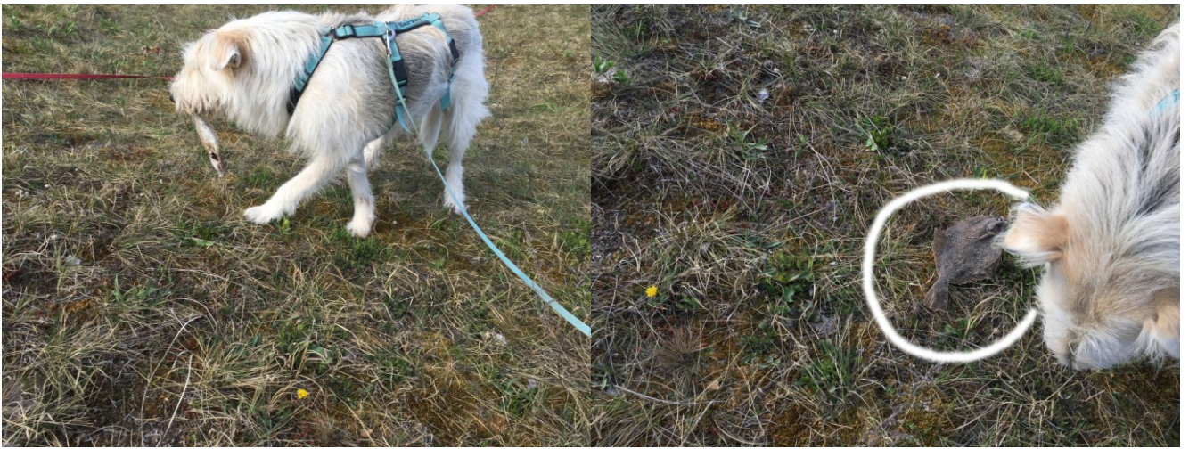
„Oh Welch ein Wunder - ne lecker Flunder!“